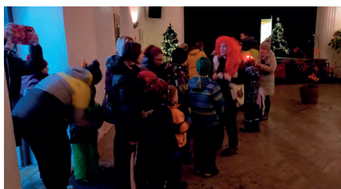
Několik fotografií z vánoční akce pro děti Přes Peklo k Mikuláši.