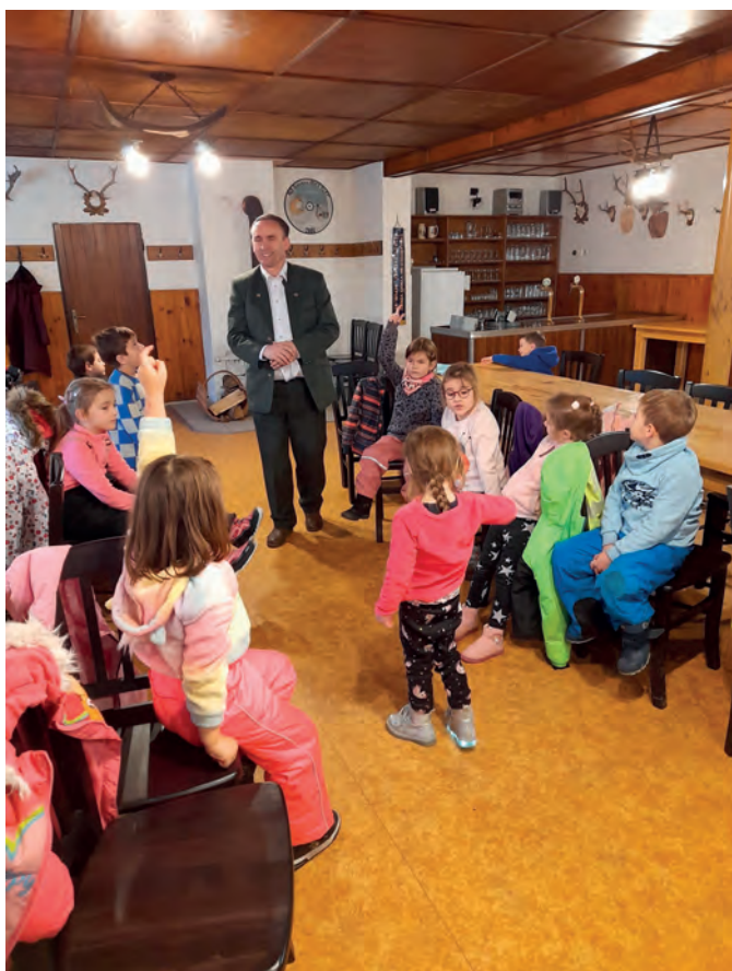
Setkání dětí na chatě Povídání v knihovně

V závěru roku nás čeká ještě poslední hon na Třešňovce, kde se rozloučíme s rokem 2023 a po té zvěři dopřejeme zasloužený klid, aby bez problémů přečkala zimu. Za myslivecký spolek Střezmá Olešnice přeji všem čtenářům klidné Vánoce a všechno dobré v roce 2024.