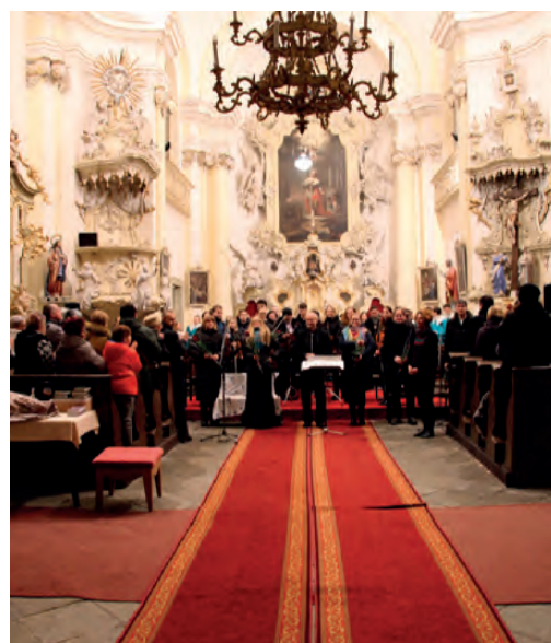
Několik fotografií z České mše vánoční Jana Jakuba Ryby v kostele sv. Víta v Častolovicích.