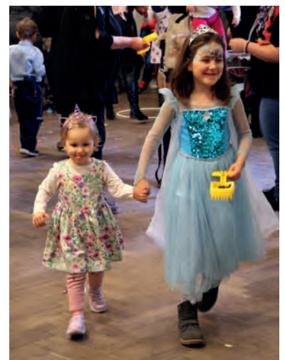
Pár fotografií z Dětského karnevalu, který se konal 26. února 2023 na sále U Lva v Častolovicích.