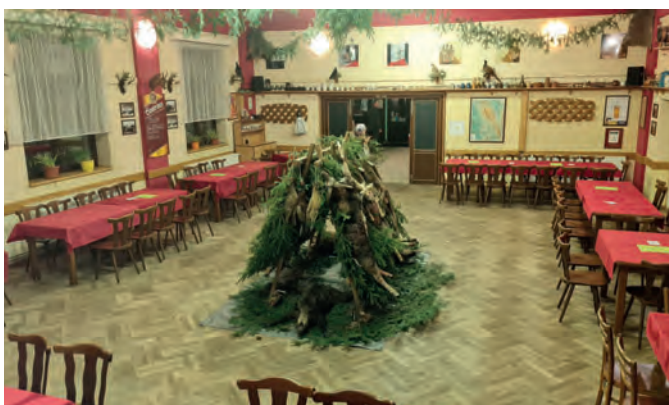
Zvěřinová tombola na plesu