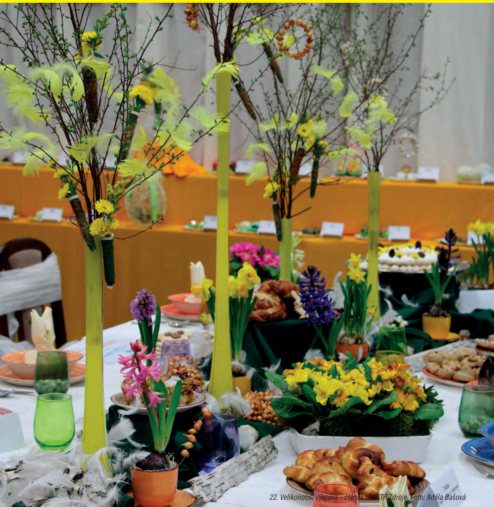
22. Velikonoční výstava – článek IIMM TRŽ Zdroje.