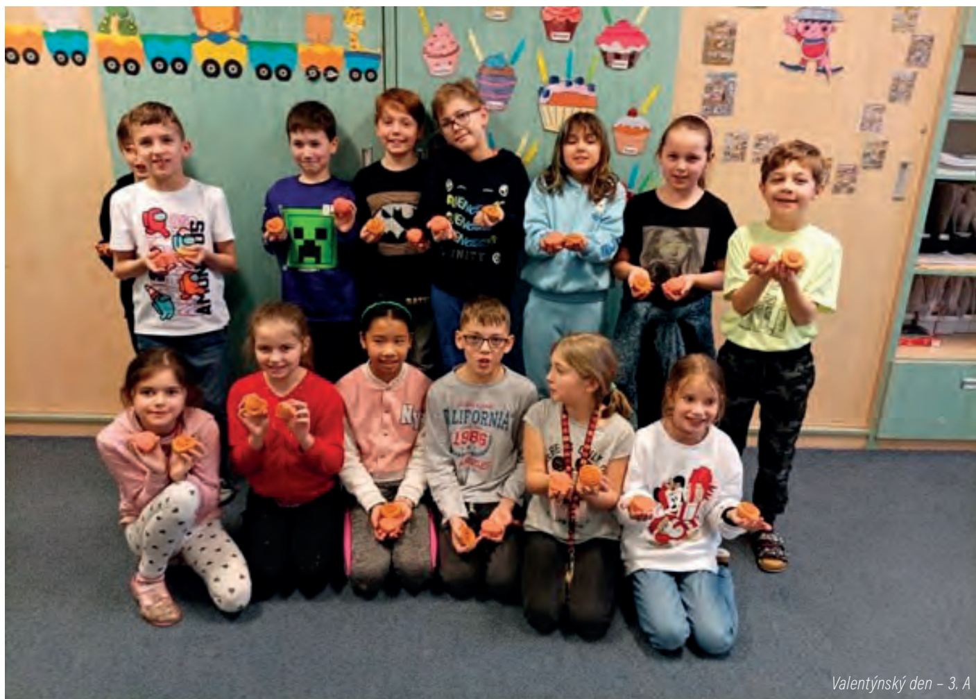
Valentýnský den - 3. A