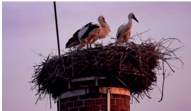
Jedna z fotografií od Rudolfa Prchlíka z června 2019.