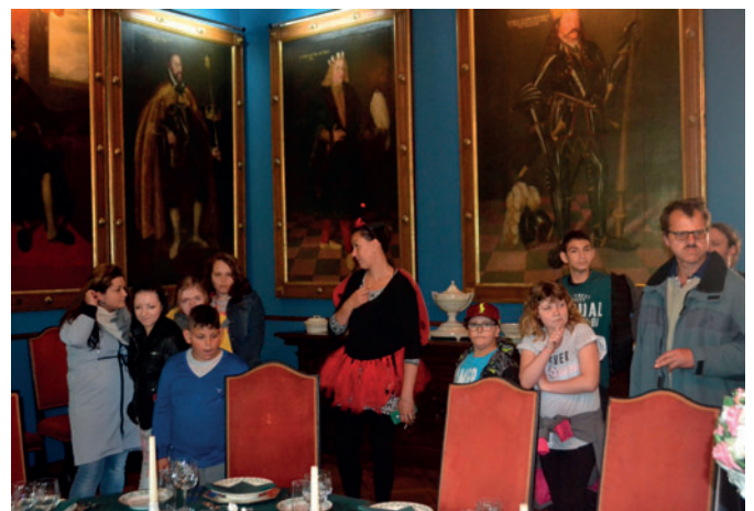
Prohlídka zámeckých interiérů.

Po příjezdu byly děti přivítány zaměstnanci zámku převlečenými do pohádkových kostýmů. Následovalo občerstvení v prostorách Oranžerie, diskotéka, prohlídka zámeckých interiérů a samozřejmě také návštěva zvěřince, projížďky golfovými autíčky po parku nebo divadlo pod širým nebem. Celý den se nesl ve znamení dobré nálady, spokojenosti a usměvavých tváří dětí a dospělých, kteří se tohoto dne účastnili, což bylo hlavním cílem.