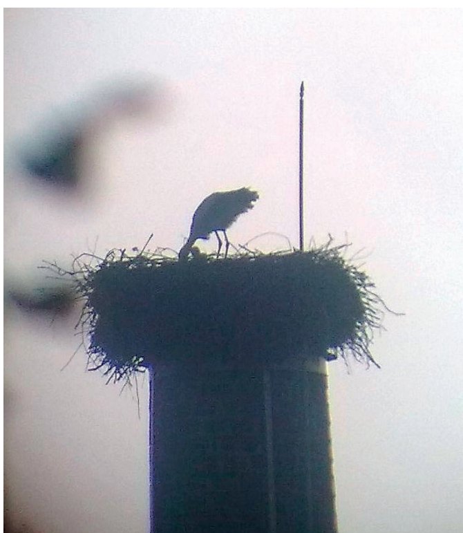
Pan Milan Línek pozoruje čápy dalekohledem ze svého domu, květen 2019.