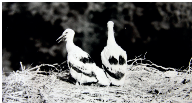
V roce 1982 se hnízdění čápům nevyvedlo, mláďata zahynula.