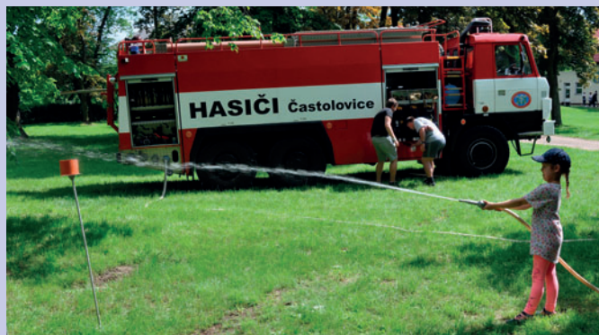
Fotografie z dětského dne 1. 6. v Sokolské zahradě a z dětské olympiády na víceúčelovém hřišti 15. 6.