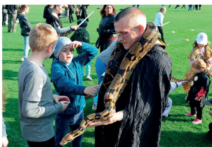
Pálení čarodějnic v areálu AFK Častolovice