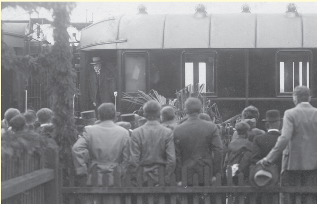
Příjezd T. G. Masaryka na nádraží do Častolovic.