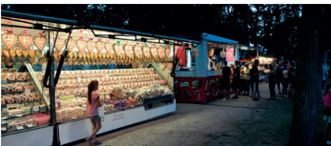
Několik fotografií z letošní častolovické pouti.