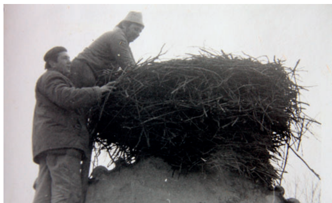
Pracovníci KPPŮP Opočno čistí v roce 1981 čapí hnízdo na častolovickém zámku.