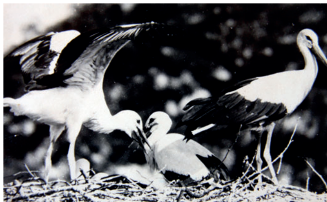
V roce 1976 čápi na častolovickém zámku zahnízdili již po padesáté a vyvedli 3 mláďata.