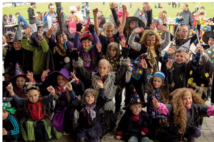
Na čarodějnický rej dorazily děti v kostýmech.

Nechybělo ani nablýskané požární auto častolovických dobrovolných hasičů. Po rozdání všech sladkých odměn byly vyzvány všechny děti, které dorazily v převlecích a kostýmech, na parket. Společně se vyfotografovaly a byly odměněny malou pozorností a losem. Kapelník častolovické skupiny Špunti vylosoval jednoho šťastlivce, kterému byla předána rodinná vstupenka na pohádkovou prohlídku zámku v Potštejně. O hudební repertoár se postaral DJ Dohnálek. S přicházejícím soumrakem se zapálila hranice. A když tma pohltila celý areál, objevily se tři záhadné postavy v kápích. Skupina Draconalis v doprovodu mystické hudby předvedla úžasnou show s hořícími meči a ohnivými řetězy, při níž se tajil dech malým i velkým divákům. Na závěr celé akce k poslechu a tanci zahrála skupina Špunt. Počasí nám i přes nepříznivou předpověď přálo, a tak se i díky tomu sešlo mnoho lidí, kteří si čarodějnický večer mohli společně užít.