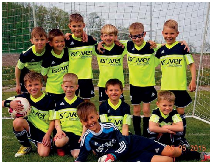
McDonald's Cup reprezentovali žáci prvního stupně.

McDonald's Cup zahájila skupina našich nejmladších fotbalistů 5. května v Dobrušce. Do tohoto okresního kola se přihlásili žáci 1.–4. třídy. Avšak i přes velikou podporu svých trenérů skončili na 4. místě. Přestože se zápasy odehrávaly v režii našich fotbalistů, inkasovali několik smolných gólů, kvůli nimž nedotáhli zápasy do vítězného konce. Turnaje se zúčastnila mužstva z Dobrušky, Opočna, Kostelce nad Orlicí a Rychnova nad Kněžnou.