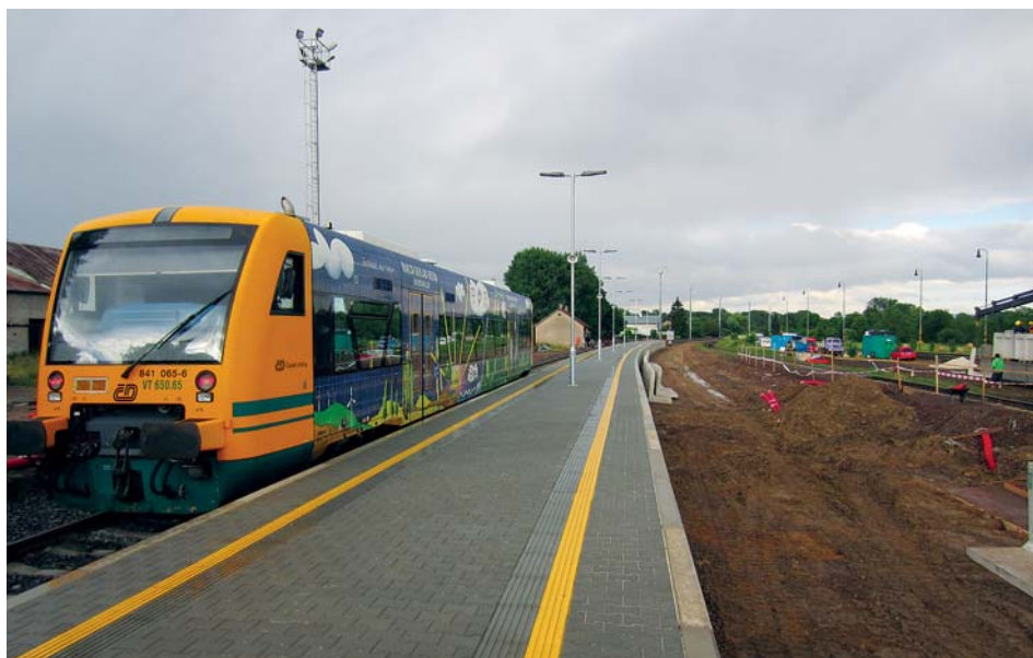
Na častolovickém nádraží je nově vybudováno bezpečné nástupiště.

Místní občané cestující vlakem jistě zaznamenali zásadní proměnu častolovického nádraží. Investor stavby, státní organizace Správa železniční dopravní cesty, se pustil do rozsáhlé stavební akce. Podobně jako v navazujících železničních stanicích, v Týništi nad Orlicí a Rychnově nad Kněžnou, dojde k modernizaci vlakového nádraží. Ta je nezbytná pro zkvalitnění logistických externích procesů souvisejících s rozšířením kapacity závodu Škoda Auto v Kvasinách. V železniční stanici Častolovice probíhá kompletní rekonstrukce, v rámci které se rozšíří kolejiště, dále dojde k výstavbě nových bezpečných nástupišť a k instalaci nového zabezpečovacího systému. Všechny stavební práce by měly být dokončeny do poloviny září tohoto roku. Potom by měl být pro cestující zajištěn mnohem větší komfort při nástupu do vlaků. Budou na ně čekat však i omezení. Nebude již přístupná nebezpečná „zkratka“ ulicí Na drahách. Škoda, že kompletnímu řešení „unikla“ hlavní nádražní budova. Důvodem je, že ta patří jiné státní organizaci – Českým drahám.