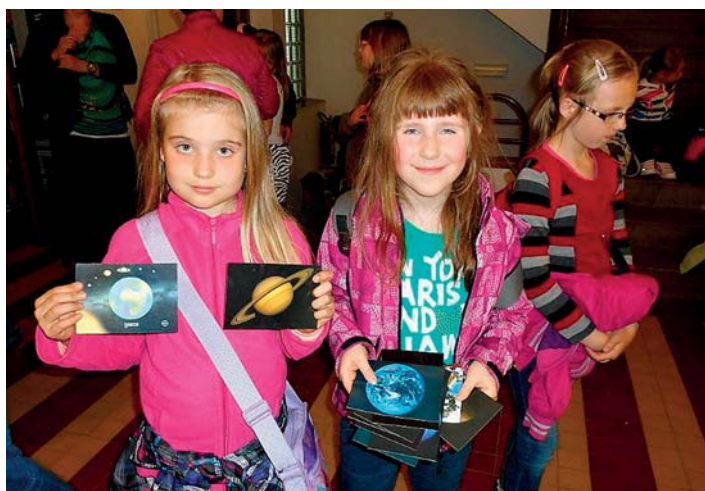
Děti si na památku nakoupily tematické suvenýry.

Ve středu 20. května se vydala školní družina na exkurzi do hvězdárny a nového planetária v Hradci Králové. Děti nejprve navštívily nové planetárium, kde pro ně byly připraveny zajímavé a naučné programy. V planetáriu žáci mohli sledovat západ slunce, noční