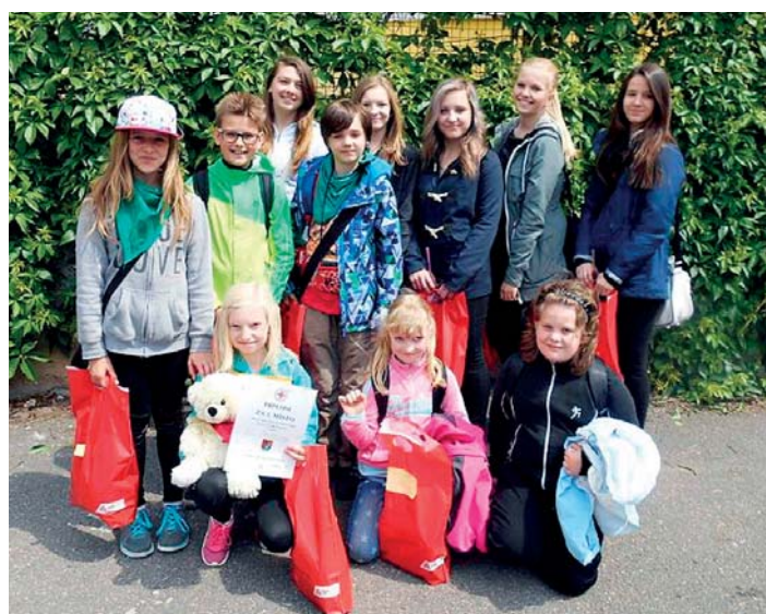
Žáci základní školy si na zdravotnické soutěži vedli skvěle.

Oblastní kolo Hlídek mladých zdravotníků se po roce vrátilo zpět do Rychnova nad Kněžnou, tentokrát do prostor tělocvičny Základní školy v ulici Komenského. V pátek 22. května se před tělocvičnou shromáždilo 8 hlídek I. stupně a 4 hlídky II. stupně, které přijely do Rychnova porovnat s ostatními svoje znalosti a dovednosti v poskytování první pomoci. Naši školu reprezentovaly hned dvě hlídky.