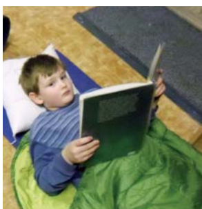
Noční dobrodružství v místní knihovně.