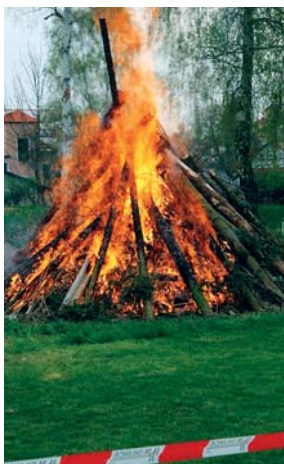
Tradiční zapálení hranice k Pálení čarodějnic zkrátka patří.

Ve čtvrtek 30. dubna uspořádala Kulturní a spolková komise společně s AFK, SRPDŠ-MŠ a Městyssem Častolovice tradiční akci Pálení čarodějnic. Pro děti bylo připraveno šest stanovišť s čarodějnickými soutěžemi – skákalo se v pytlích, létalo se na koštěti okolo člunků, překonávaly se překážky s lopatami a míčky, do kotlíku s lektvarem se házely želvičky, stateční soutěžící lovili čarodějnickou havěť v lahvích naplněných různým „fujtajblem“ a někteří si zahráli na umělce a pomohli obrázky ozdobit chaloupku pro ježibaba.