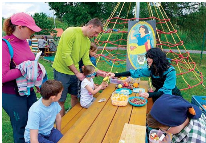
Děti na jejich cestě provázely známé pohádkové postavičky.