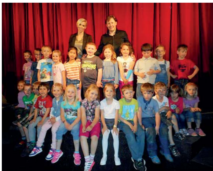
Na závěr kouzelnického čísla se děti vyfotily se známými osobnostmi.