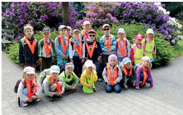
Den dětí třída Sluníček strávila v zámeckém parku.

Dětský den jsme prožili se třídou Sluníček opravdu báječně. Dopoledne jsme si povídali o dětech na celém světě, poté jsme si společně zasoutěžili a zatančili s kamarády. Pomyslnou třešničkou na dortu byl skvělý zmrzlinový pohár v Bazylicce u Václavíků. Moc děkujeme výboru SRPDŠ za příspěvek na zmrzlinový pohár pro všechny děti v MŠ.