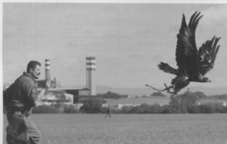
Orel v letu vypadá opravdu impozantně. Setkání sokolníků u častolovického Orsilu.