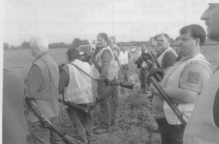
Myslivci v reflexních vestách se chystají vyháňet divočáky z kukuřice