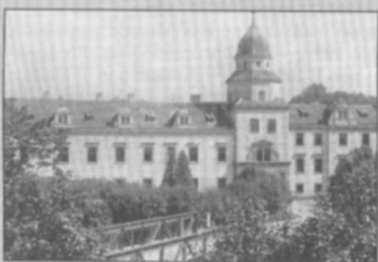
☐ Zámek a železný most na pohlednici z roku 1932.

Vážení spoluobčané, pokud i vy vlastníte nějaké historické fotografie, dokumenty, případně jiné materiály ze života obce a jste ochotni se o ně podělit nebo máte k uveřejněným fotografiím nějaké poznatky, kontaktujte mne prosím osobně nebo na mobilním telefonu číslo 724178772.