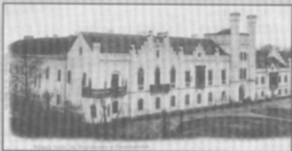
☐ Zámek hrab. ze Sternberka v Častolovicích - nedatováno, vyšlo nákladem A.J. Jelínka.