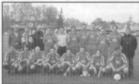
□ Mužstvo AFK Častolovice A přezimuje na 2. místě tabulky I.B třídy.

První polovina fotbalové sezony 2006-2007 skončila i pro všechny týmy častolovického AFK. Jak si v ní vedly? Určitě převážně úspěšně.