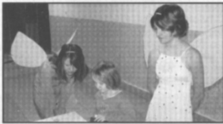
□ 20. 12. - Žáci druhého stupně ZŠ připravili pro své mladší spolužáky Pohádkovou vánoční cestu.