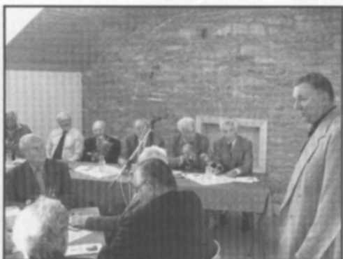
□ Slavnostní zahájení Zahradry Východních Čech 2006 v nově otevřené společenské místnosti zahrádkářského domu.

Jako největšího úspěchu si všichni častolovičtí zahrádkáři cení dokončení přístavby u sokolovny, která bude sloužit jak pro potřeby výstav, tak pro vlastní spolkovou činnost