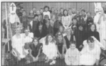
□ 5. 12. - Mikuláš: Některé třídy byly plné bytostí nebeských i pekelných.