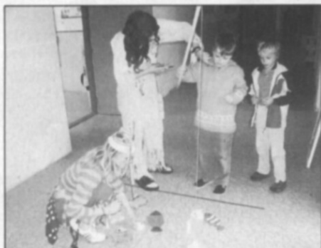
☐ Putování za pohádkami.

V předvánočním čase jsme pro žáky 1. a 2. stupně uspořádali bruslení spojené s výstavou betlémů v