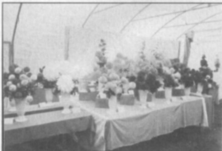
□ Výstava "Zahrada Východních Čech 2004" byla rozšířena i o květiny - jiřiny, jiřinky, chryzantémy.

V měsíci únoru bude znovu provedena degustace ovoce (jablek), která ukáže, jaké odrůdy jsou pro naši oblast nejlepší, nejchutnější a