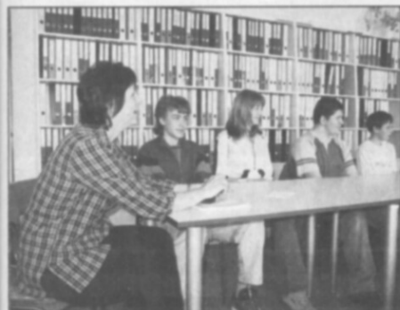
☐ Volíme si povolání.