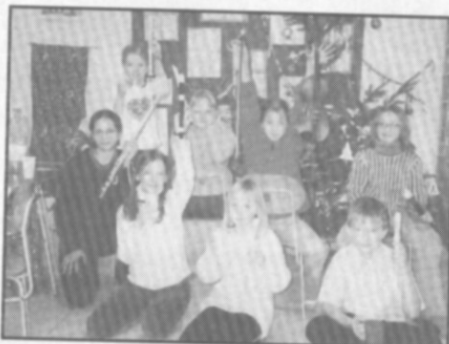
□ Z předvánočního hudebního posezení mladých muzikantů.

Měsíc prosinec bývá většinou ve znamení starostí, shonu a příprav na vánoční svátky. Ze všech koutů k nám doléhají tóny známých lidových koled a vánoční hudby.