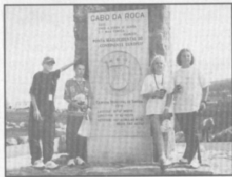
□ Na nejzápadnějším výběžku starého kontinentu - Cabo da Roca.

Byly to roky tvrdé přípravy, korunované pěkným úspěchem. Spousta práce s dětmi, hodně času nad rámec mého pracovního úvazku. Nakonec, i moje rodina tím trpěla. Neangažují se jen v soutěžích základních škol, pracuji také pro okres, kraj, pořádáme dopravní soutěže pro postižené děti a pro zvláštní školy. Je to všechno hodně časově náročné. Myslím si, že kdyby si to každý zkusil, postoje některých lidí k dopravní výchově dětí by byly poněkud jiné.