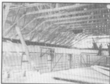
□ Po odkrytí starého stropu následovaly práce na výměně střešní konstrukce.

- od 9. prosince 2003 je opět v provozu častolovická sokolovna?