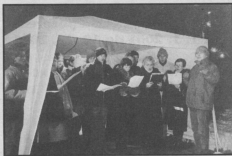
□ 2. ročník Zpívání u vánočního stromu - zdá se, že v Častolovicích vzniká hezká vánoční tradice.

V úterý 25. prosince na Boží hod vánoční uspořádal Sbor dobrovolných hasičů Častolovice ve spolupráci s obecním úřadem a častolovickým Pěveckým sdružením Melodica 2. ročník Zpívání u vánočního stromu.