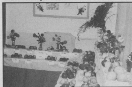
□ Návštěvníci výstavy mohli shlédnout 181 odrůd jablek.

- Výstavní areál se rozšířil na téměř 900 m 2 a bylo zakoupeno dalších 6 stanů pro umístění exponátů od velkopěstitelů.