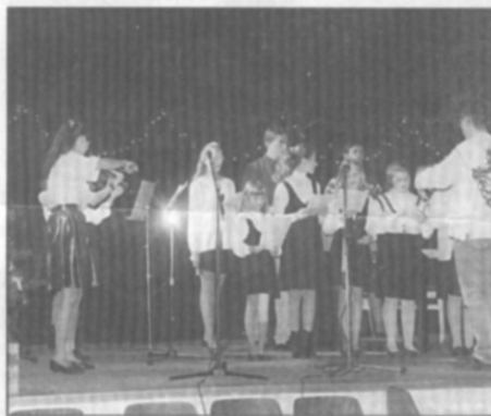
□ "Kyrie eleison ..."