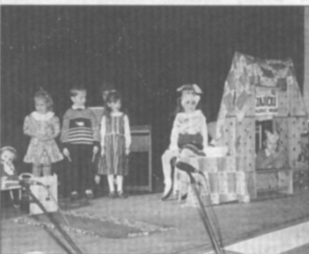
□ Zajíček Ušáček v podání dětí mateřské školy.