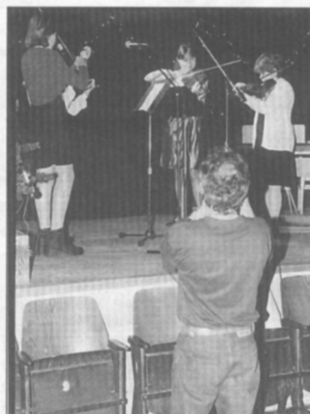
□ Houslové kvarteto častolovické ZUŠ nesmí chybět na žádném domácím videu.