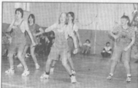
□ Taneční skupina děvčat z Kostelce nad Orlicí odstartovala vánoční prázdniny častolovické ZŠ v rytmu diska. dokončení na str.11

Potom jsme sešli zpátky do přízemí podívat se na výstavu s vánoční tematikou. Hned u vchodu do výstavní místnosti stály maškary v podobě Barborky oblečené v bílých šatech se zakrytými vlasy a na hlavě věnečkem z myrty. Potom ná-