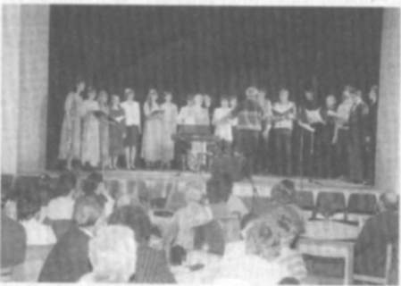
□ Spojené sbory při závěrečné písni "S touhou mé myšlenky".

Kulturní, sociální a školská komise při Obecním úřadě v Častolovicích sděluje, že 1 100,- Kč vybraných jako dobrovolné vstupné na vystoupení pěveckých sborů Chorus coronae a Chorus minore, které se konalo 3.1. 1998 v sále restaurace "U Lva", bylo věnováno na humanitární účely, konkrétně Ústavu sociální péče pro mládež v Černíkovcích.