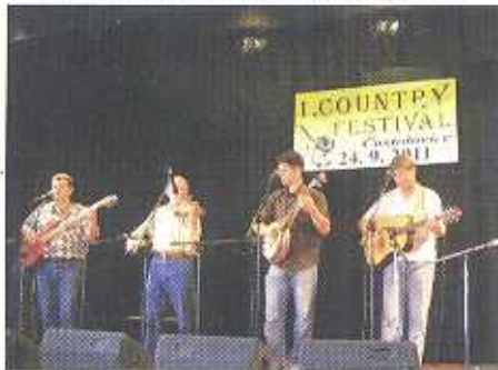
Uskutečnil se 1. ročník Country festivalu (str. 6)