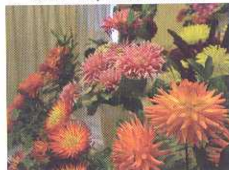
K vidění bylo hned několik kolekcí jirín