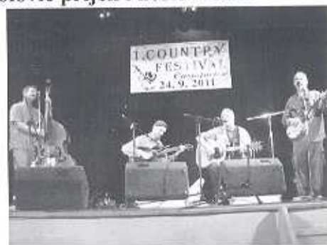
Host z USA: skupiny Lazy Pigs