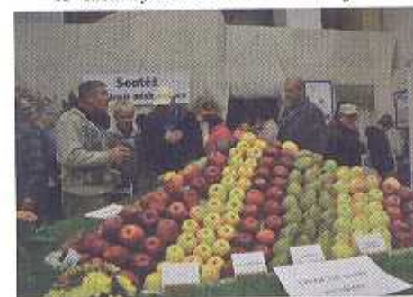
Nechyběl ani symbol výstavy - jablka