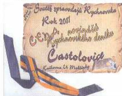
Zdroj již podruhé získal cenu novinářů v soutěži zpravodajů (str. 6)