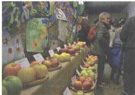
13. ročník výstavy Zahrada východních Čech si nenechaly ujít tisíce návštěvníků (str. 12)