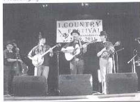
Bluegrassová skupina Foot Rail

Členové kapely zahráli na kytaru, banjo, mandolinu, basu, dobro a housle a zazpívali jak v angličtině tak v rodném jazyce.