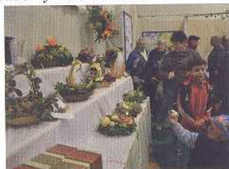
Soutěžní misky obdivovali mali i velci