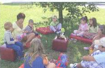
Nezahálela ani častolovičtí knihovna - děti se pobavily u Prázdninového počteníčka (str. 4) Máte pěknou fotografii z Častolovic? Pošlete ji na zdrojcastolovice@seznam.cz