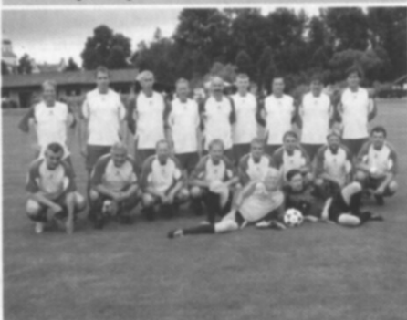
Stará garda AFK Častolovice