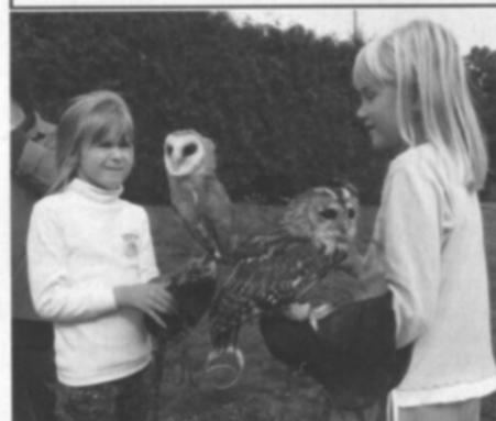
Nadšení vzbudili i draví ptáci