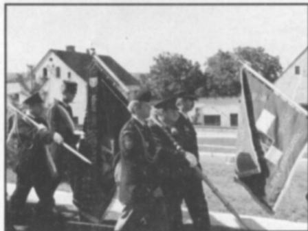
□ Čestná stráž SDH Častolovice při odchodu z kostela v Prusech.

Hned po příjezdu do Prusů započala příprava praporečnicků a čestných stráží na pochod do místního kostela, kde se konala slavnostní mše. Přibližně po kilometru cesty dorazil šik uniformovaných hasičů se zástavami, spolu s hosty a obyvateli obce, do kostela, v němž se konala bezmála dvouhodinová mše, při které byl vysvěcen prapor OSP Prusy a soška sv. Floriána. Zástava častolovických hasičů byla při slavnostním aktu nesena v čele průvodu, hned za praporem místního sboru, a čestné místo měla