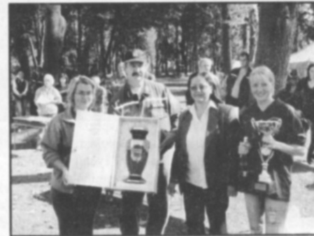
Putovní pohár starosty obce Častolovice si v kategorii žen odvezlo družstvo Opočna.

Ve finále získali putovní pohár starosty obce Častolovice muži z Tutlek (25:50s) a ženy z SDH Opočno (26:67s). Všechna mužstva si z Častolovic odvezla věcné dary, vítězové finále putovní poháry.