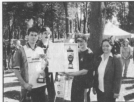
Putovní pohár starosty obce Častolovice ve své kategorii získali muži Tutlek.

Za pěkného počasí se ke startu připravilo 15 družstev mužů a 7 družstev žen. Soutěž se zúčastnili i hasiči (ochotniczy) z družební polské obce Kondratowice. Na závodní dráze u Sokolské zahrady všechny sou-