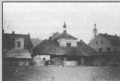
□ Pohled na kapli od řeky Bělé v 70. letech 20. století.