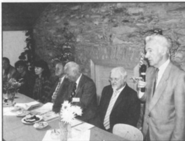
Slavnostní zahájení Zahrady Východních Čech 2007 proběhlo v nové budově častolovických zahrádkářů.