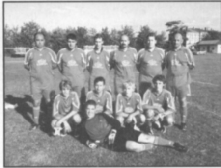
☐ Proti mužstvu Czarni Kondratowice nastoupil za Častolovice tým složený z hráčů AFK B a dorostu.