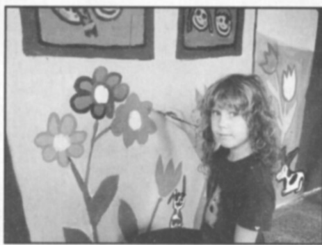
□ „Že se mi to povedlo?“