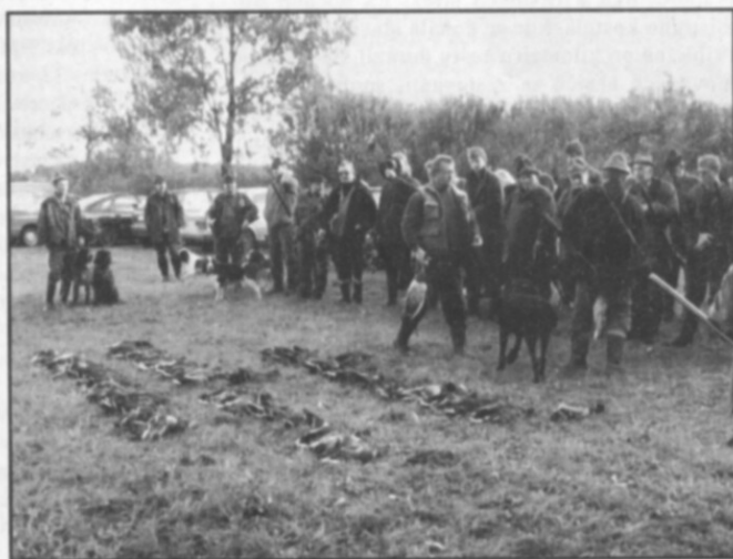
☐ Letošní lovy kachen končily nebývalé bohatými výřady.

➤ v poslední době se v honitbách v blízkém okolí objevují stopy ukazující na organizované pytláctví. Proto si dovoluujeme požádat všechny občany, kteří by se zvláště v nočních hodinách stali svědky pohybu podezřelých dopravních prostředků, například neznámých terénních aut, mimo vyznačené cesty, nebo dokonce střelby na srnčí či jinou zvěř, aby ihned kontaktovali a upozornili na takové jednání členy našeho mysliveckého sdružení nebo státní policii!!!!