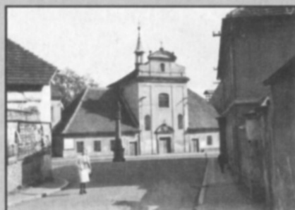
□ Křižovatka ulic Komenského a Masarykova ještě s kaplí sv. Václava a mariánským sloupem ve 20. - 30. letech 20. století.