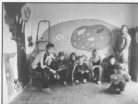
□ Akce „Malování zastávky ČD“.

Až půjdete kolem, stavte se. Přivětivé jásavé barvy fantazijní krajinky s vláčkem, loukami, rybníkem, stromy, zvířátky, ptáčky, ale i školou, ba dokonce i s Machem a Šebestovou stojí za vidění. Malí výtvarníci tak přispěli chvályhodným činem i k nadcházejícímu stému výročí zdejší školy. Teď už si musíme jen přát, aby se sprejeři chytili za nos a obloukem se tomuhle místu vyhnuli.