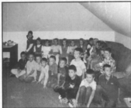
Letošní prvňáčci ve školní družině.

posílil výuku informatiky, dal možnost žákům studovat od 6. ročníku druhý cizí jazyk a rozhodně nezapomněl na celkové posílení dvou hlavních předmětů – českého jazyka a matematiky. Tyto změny ale nejsou jediné. Se zavedením nového Školního vzdělávacího programu se výrazně posiluje zodpovědnost rodičů a žáků za své vzdělání. Dřívější schéma zodpovědnosti za vzdělání 1. učitel, 2. žák, 3. rodič se podle Rámcového vzdělávacího programu mění na schéma 1. žák, 2. rodič, 3. učitel. Škola nabízí materiální zabezpečení výuky, znalosti a zkušenosti svých pedagogů a pomocnou ruku při řešení výchovných problémů. Od rodičů se očekává zodpovědnější přístup ke vzdělání svých dětí. Měli by mít