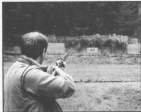
☐ Střelba na pohyblivý terč kance.

zatímco pro většinu dalších zájmových organizací a sdružení, především těch sportovních, je léto pravidelně obdobím mnoha společných aktivit, u nás myslivců to bývá jinak. Lze velmi zjednodušeně a s nadsázkou říci, že se v jarních měsících