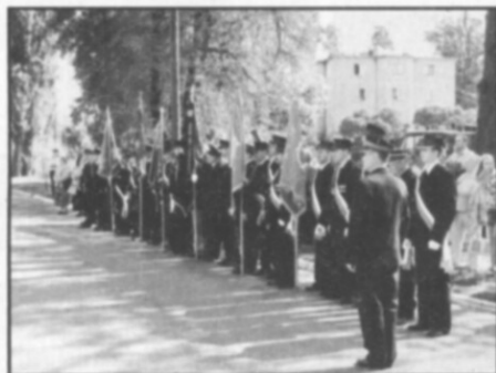
□ Praporečníci před hasičskou zbrojnicí v Prusech.

ni obce Prusy, kde se konaly výše zmiňované oslavy.