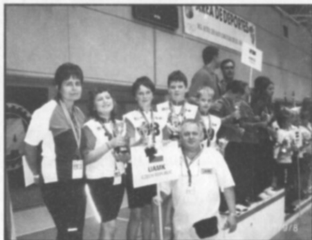
Častolovický tým se stříbrnými medailemi vicemistrů Evropy na madridských stupních vítězů.

Soutěž letos probíhala v krásné sportovní hale poblíž španělského hlavního města Madridu. Soutěžilo se v teoretických znalostech – řešení dopravních křížovek, hodnocení bezpečné dopravní situace na silnici, hledání bezpečné