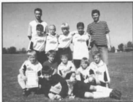
☐ Mladší žáci obsadili v Memoriálu Zygmunta Olszewskiego v polských Kondratowicích druhé místo.

stejně úrovni jako naše áčko, a tak není divu, že výběr Častolovic přehráli jasně 6:0.