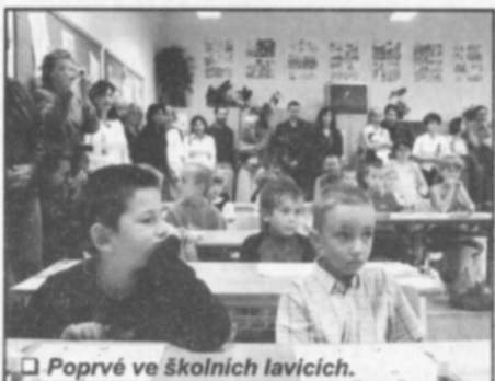
Poprvé ve školních lavicích.

obsadili vynikající 2. místo a tím zkompletovali sadu medailí z ME, na které se pravidelně probíhávají od roku 2003 (2003 – 8. místo, 2004 – 1. místo, 2005 – 3. místo, 2006 – 1. místo).