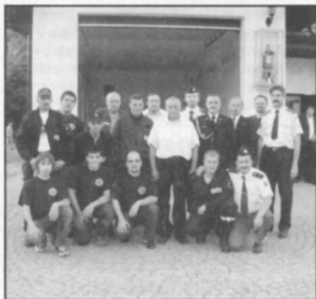
□ Společné foto hasičů z Častolovic, Kondratovic a Prus před nově otevřenou a vysvěcenou zbrojnicí v Prusech.

Po mši vyrazil průvod zpět před hasičskou zbrojnicí v Prusech, kde následovalo její vysvěcení. Posledním bodem našeho bohatého programu byla účast na soutěži v požárním sportu. Soutěž se konala na fotbalovém hřišti v Prusech. Naši muži nejprve startovali podle polských pravidel pro tento sport a obsadili v konkurenci 8 družstev pěkně 4. místo, přičemž požární útok v této