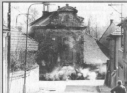
□ Odstřel kaple dne 25. dubna 1975.

Vážení spoluobčané, pokud i vy vlastníte nějaké historické fotografie, dokumenty, případně jiné materiály ze života obce a jste ochotni se o ně podělit nebo máte k uveřejněním fotografiím nějaké poznatky, kontaktujte mne prosím osobně nebo na mobilním telefonu číslo 724178772.