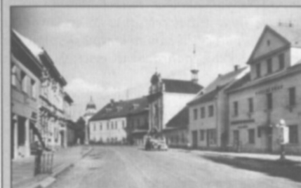
□ Náměstí dne 18.12.1937.

Vážení spoluobčané, pokud i vy vlastníte nějaké historické fotografie, dokumenty, případně jiné materiály ze života obce a jste ochotni se o ně podělit nebo máte k uveřejněným fotografiím nějaké poznatky, kontaktujte mne prosím osobně nebo na mobilu 724178772.