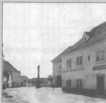
□ Náměstí na počátku minulého století.