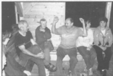
□ Říjnové přátelské posezení u myslivecké chaty.