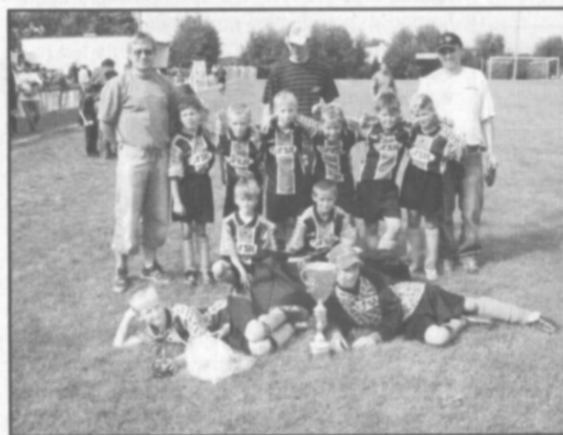
Przeworno - vítězné družstvo častolovických elévů.

Sobotní program byl věnován fotbalovému měření sil. Naši elévové suverénně kráčeli turnajem až do finále, kde po remízovém výsledku s hostitelským Ogniskem Przeworno se k nim v závěrečných pokutových kopech při-