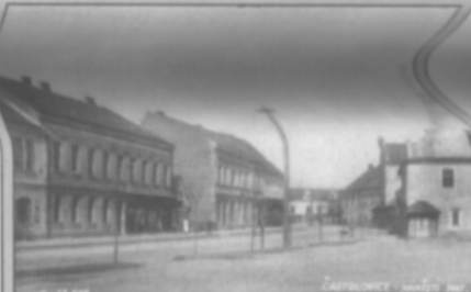
□ Náměstí Svatopluka Čecha v roce 1922.