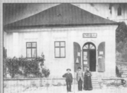
□ Obchod smíšeným zbožím Václava Tichého na počátku 20. století. Později domek koupil pan Hovorka, dnes jej vlastní pan Málek.