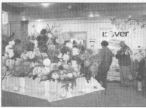
□ Krása řezaných květin.

Plakáty v Častolovicích a okolí zvou na 7. ročník výstavy ovoce, zeleniny a květin ZAHRADE VÝCHODNÍCH ČECH 2005, kterou pořádá ZO ČZS v Častolovicích ve spolupráci s Územní radou ČZS a Obecním úřadem Častolovice. Je 7. říjen, den zahájení výstavy, tak se pojďme společně podívat, co pořadatelé pro návštěvníky letos připravili.