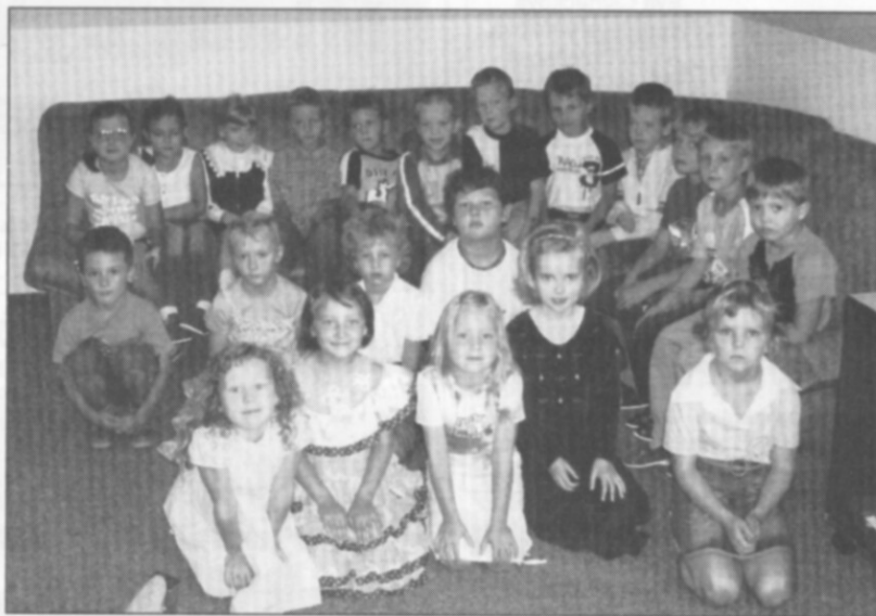
□ 1. třída školního roku 2005/06.