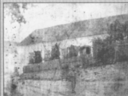
□ Hraběcí hospoda (dnes kulturní zařízení U Lva) na počátku 20. století. Vlevo v pozadí špýchar, dnes sokolovna.

Vážení spoluobčané, pokud i vy vlastníte nějaké historické fotografie, dokumenty, případně jiné materiály ze života obce a jste ochotni se o ně podělit, nebo máte k uveřejněným fotografiím nějaké poznatky, kontaktujte mne prostřednictvím mobilu 724 178 772 nebo pevné lince 494 323 855.