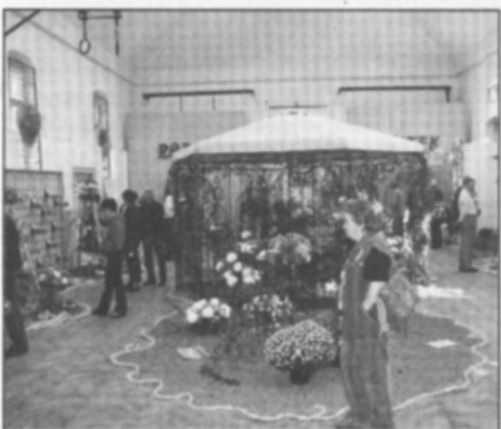
□ Hlavní výstavní sál.

Mezi davy proudících lidí zahlédneme pana Helmicha. Provází několik čestných hostů. Počkáme, až splní svou hostitelskou povinnost, a nedá nám to, abychom se nezeptali na pár čísel. V první řadě se zajímáme o vystavující. "Letos vysta-