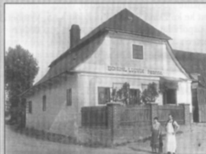
□ Řeznictví Bohumila Ludvíka (později Trojákoví) na začátku 20. století. Dnes už zde domek nestojí, musel ustoupit při rozšíření křižovatky před školou.