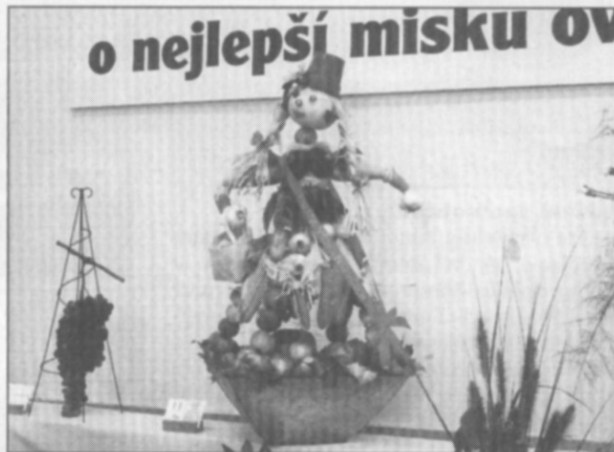
□ O nejlepší misku ovoce.

A co říci závěrem? Častolovičtí zahrádkáři, děkujeme. Za výstavu, za vaši práci a v neposlední řadě za dobrou propagaci naší obce. mp