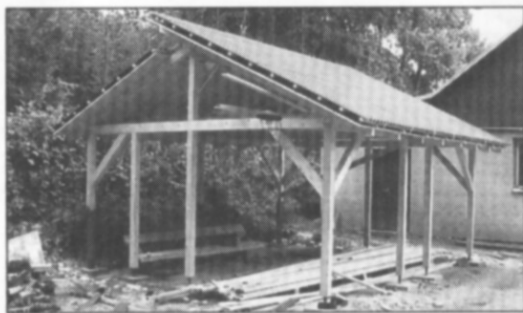
□ Snímek zachycuje stavbu nového přístřešku. Takto vypadal stav na konci srpna, dnes již má stavba libivé opláštění z palubek.