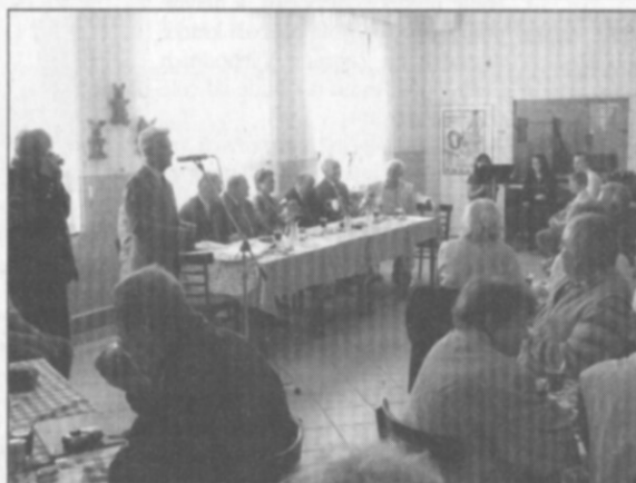
□ Jednatel ZO ČZS Častolovice zahajuje slavnostní otevření výstavy.

Reportáž z otevření výstavy Zahrada Východních Čech