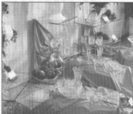
□ Jablka a broušené sklo.

Rojka, v nichž se zamýšlí nad nadměrným použitím chemie v zahrádkářství a zemědělství vůbec, a vyslovuje přesvědčení, že úkolem zahrádkářů je propagovat a pěstovat odrůdy, které nepotřebují chemickou ochranu.