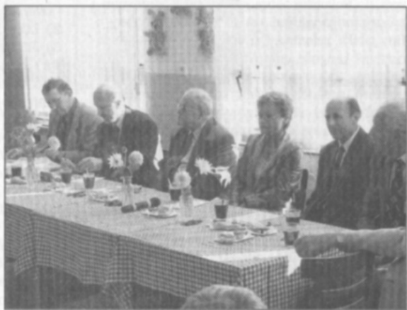
□ Čestní hosté.