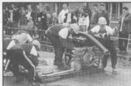
Častolovičtí muži si 22. září 2001 v soutěži O putovní pohár starosty Častolovic vyběhli krásné 4. místo.