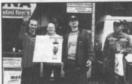
V kategorii mužů se z poháru častolovického starosty radovalo družstvo Bystrého A.

Finále žen, tedy boj o putovní pohár starosty Častolovic, zamíchalo pořadím. Z ví-