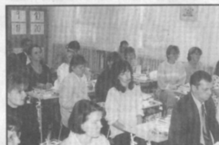
□ 1. třída - po dlouhé době opět v lavicích.