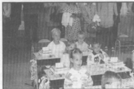
□ 1. třída - poprvé v lavicích.

Slavnostním shromážděním učitelů, žáků a pozvaných hostů byl v pondělí 3. září 2001 zahájen v naší základní škole nový školní rok.