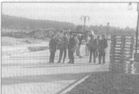
● Kolaudace komunikací v ulici Široká proběhla bez závad.

"Viděl jsem v životě ledacos, ale takhle pečlivě udělané příjezdy, betonové obrubníky, každý detail, s tím jsem se skutečně ještě nesetkal. To není betonářská nebo silničářská práce, to je spíše práce truhlářská." mp