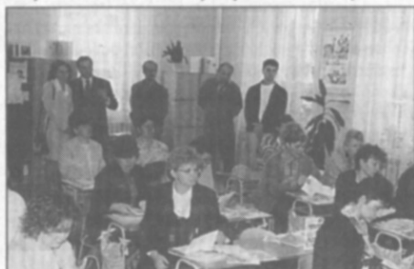
● Zatímco si prvňáčci prohlíželi školu, zaujali jejich mäs- ta v lavicích rodiče. Jaké to bylo po tolika letech?

Celkový počet žáků se bude pohybovat okolo 230. Většinu nových žáků tvoří samozřejmě prvňáčci, které bych chtěl