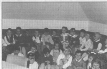
● Velká rohová sedačka ve školní družině prvňáčky doslo- va uchvátila.