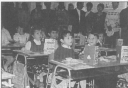
● Poprvé ve školních lavicích. Jaké to asi bude?