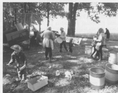
Zahradkáři se účastnili tradiční Pohádkové cesty a pro děti připravili netradiční úkoly.

Kromě této činnosti se museli zahradkáři zabývat i dalšími úkoly spojenými s novým Občanským zákoníkem a organizačními věcmi. Rozhodně stojí za zmínku, že zahradkářské osady Bělá 1, Bělá 2 a Konopáč jsou plnou součástí městyse a přičiňují se o zkrášlení našeho okolí. V poslední době se u osady Konopáč podstatně zkvalitnila zahradkářská péstitelská úroveň a kvalita. Drtivá většina zahrád-