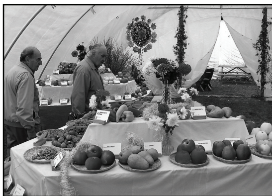
□ Zahrada Východních Čech 2007.

Pro milovníky květin bude připravena celá řada kvetoucích rostlin (chryzantémy, jiriny, jirinky, begonie), květin ozdobných listem a mnoho květin z dovozu (Nizozemsko). Mnoho příznivců jistě potěší přehlídka léčivých rostlin z Botanické zahrady UK Hradec Králové. Poprvé budou vystavovat v Častolovicích některé organizace, které mají velmi blízký vztah k přírodě. Jedná se nejen o myslivce a včelaře, ale také o kaktusáře a pěstitele bonsají.