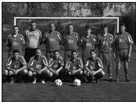
□ AFK Častolovice B.