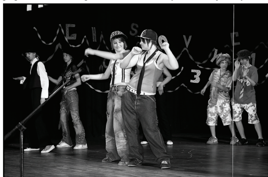
□ Ze školní akademie.

Tolik příprav, tolik těšení, obav i starostí to už od podzimu bylo – a vidíte, dlouho očekávaný termín – 30. květen až 1. červen je za námi... Dlužno říci, že dobrá věc se podařila: oslavy 666. výročí prvé zmínky o Častolovicích spojené s besedou o velké knize Častolovice Jiřího Václavíka (o němž píšeme na jiném místě), 100. výročí otevření Jubilejní obecné školy c. k. Františka Josefa ověnčené velkou výstavou ve škole současné, 30. výročí otevření moderní mateřské školy, jakož i letošní Mezinárodní den dětí 1. června už tedy patří do vzpomínek, ale připomeňme si alespoň některé momenty těchto zajímavých tří víkendových dní: