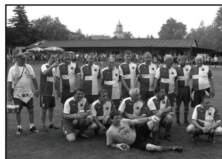
☐ Mužstvo fanoušků SK Slávia Praha.