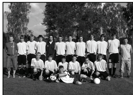
□ Dorost AFK Častolovice.

Rovněž A-mužstvo má za sebou nevydařenou sezónu – skončilo s 33 body na 10. místě I.B třídy. Tato soutěž byla letos velice vyrovnaná, o čemž svědčí, že tři kola před koncem bylo v pásmu sestupu hned 6