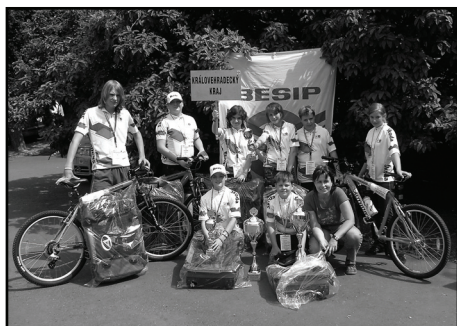
☐ Častolovičtí cyklisté – Mistři České republiky v Soutěži mladých cyklistů.

Cyklisté z Častolovic excelovali na celostátní soutěži mladých cyklistů