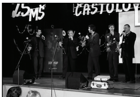
□ Křest knihy Častolovice obohatila svými spirituály vokální skupina Vockap.

Sobota byla velkým dnem školy. Usilovná práce ředitelů i celého pedagogického sboru byla patrná z proměny školních tříd. Přehledný průřez historií školy, poutavým způsobem vyzdobené třídy a moderní učebny, přehlídka prací a úspěchů žáků a mnoho dalších zajímavostí se podařilo představit všem návštěvníkům. Ani mateřská škola nezůstala pozadu. Své malé království dokázala rovněž nakrášlit a skvěle prezentovat. V odpoledních hodinách oslavy vyvrcholily školní akademií v sále U Lva. Návštěvnost byla tak veliká, že byl zaplněn do posledního místa. Celou sobotu probíhal současně také program na