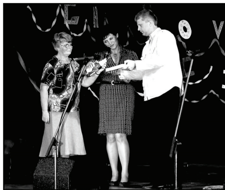
□ Slavnostní křest knihy Častolovice proběhl 30. května v sále U Lva.

V počtu tisíc výtisků vydal Městys Častolovice v květnu 2008 téměř šestisetstránkovou publikaci Jiřího Václavíka nazvanou prostě ČASTOLOVICE. Podle grafického návrhu PhDr. Jana Tydlitáta, v grafickém zpracování Františka Kubíčka, s úpravou fotografií Václava Frydrycha a jazykovou korekturou Jany Albrechtové vytiskl Uniprint, s.r.o., Rychnov nad Kněžnou.