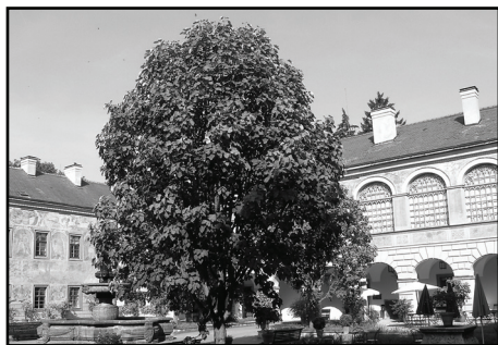
□ Topol Wilsonův na nádvoří zámku.

Z čínské oblasti pochází i třetí výjimečná dřevina častolovického zámeckého nádvoří – AKTINIDIE ČÍNSKÁ – pnoucí druh rostoucí zde při zdi, nalevo od vchodu do zámecké kavárny. Upoutává svými sametově zelenými a poměrně velkými listy, zajíma-