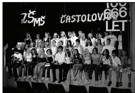
□ Závěr akademie patřil oskarové Falling Slowly.

Poděkování za tento nezapomenutelný sváteční víkend patří jak návštěvníkům, tak všem organizátorům a sponzorům, kteří tak obětavě přispěli ke zduaru oslav. -al-