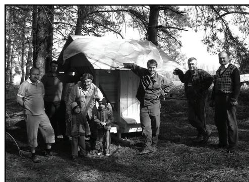
□ Nový krmelec byl právě dovezen na Častolovskou Horku