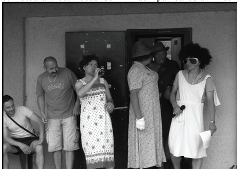
□ Servisní tým AFK s „moderátorkou“ celé akce.