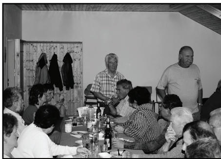
□ Na akcích zahrádkářů je vždy plno a panuje dobrá nálada.

Ve výtu zahrádkářských aktivit nemůžeme opomenout vyhodnocení výtvarné soutěže, kterou ZO ČZS spolu s vedením častolovické školy vyhlásila. Žáci z jednotlivých tříd kreslili obrázky na téma „Děti a příroda“. Je potěšitelné, že v naší základní škole je mnoho šikov-