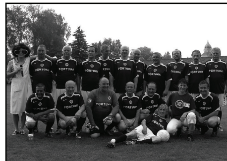
☐ Mužstvo fanoušků AC Sparty Praha.

Vikendové oslavy 666. výročí první zmínky o naší obci zakončilo v neděli 1. června utkání místních příznivců slavných pražských „S“, tedy Sparty a Slávie.