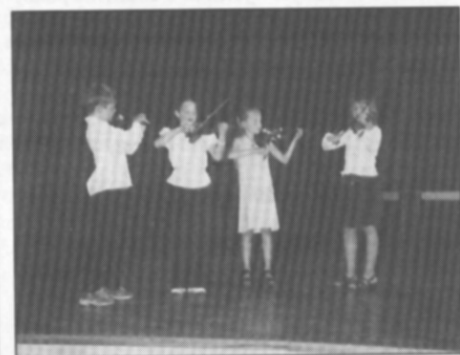
□ Malý smyčcový kvartet (žáci PHV).

Poděkování patří všem hudebníkům i jejich hos-