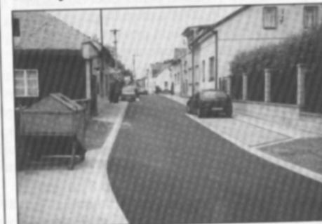
Práce byly zahájeny v dubnu 2005 a hodnota díla je 1.513.000,- Kč.

- firma Stavitelství Vamberk dokončila koncem června práce na rekonstrukci druhé části Husovy ulice?