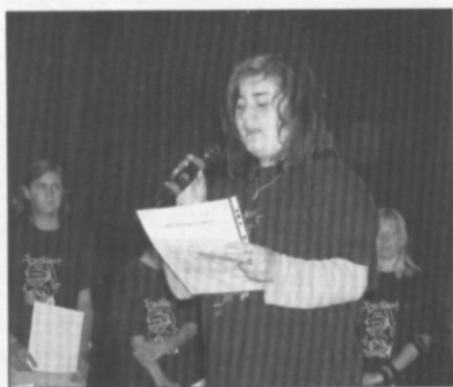
□ Rozloučení z častolovickou školou.

Oproti tomu bylo uděleno na závěr roku 54 pochval třídním učitelem, vesměs za výborný prospěch a příkladné chování, popř. za reprezen-