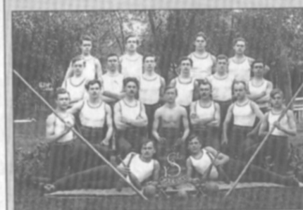
□ Sokol Častolovice v roce 1913

Vážení spoluobčané, pokud i vy vlastníte nějaké historické fotografie, dokumenty, případně jiné materiály ze života obce a jste ochotni se o ně podělit nebo máte k uveřejněným fotografiím nějaké poznatky, kontaktujte mne prosím na mobilu 724 178 772 nebo pevně lince 494 323 855.