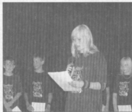
□ Loučení s 9. třídou

V letošním školním roce opouští školu 36 žáků devátého ročníku a dva žáci z pátého ročníku. Přestože letos byla přijímací řízení organizová-