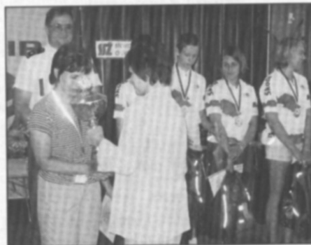
□ Vítězové celostátního kola soutěže mladých cyklistů - 2. kategorie.