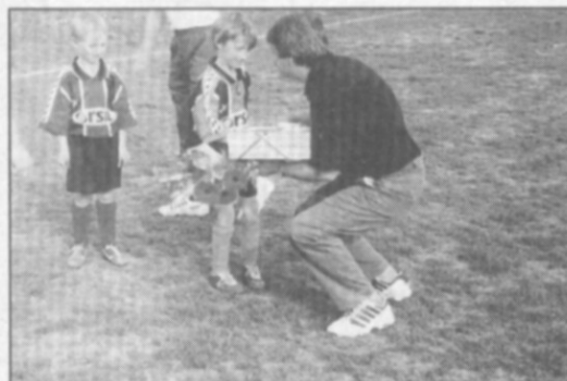
"Všechno nejlepší, trenéře!"

Nejlepší pro častolovický fotbal by bylo, kdyby se lidi dali dohromady. Vždyť fotbal