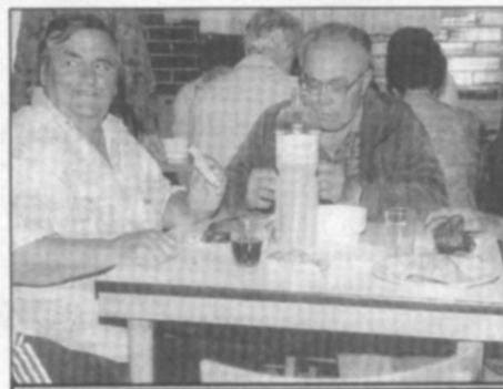
... a na konec přátelské posezení při kuřátku.