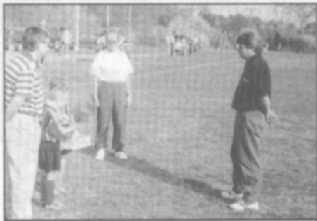
Gratulovali starosta obce, prezident klubu i zástupci žákovského týmu....

Po stavbě jsem už závodně fotbal nikdy nehrál. Tím to skončilo. Zahrají si občas za "staré pány", co se tady na hřišti scházíme, ale jinak od té doby pracuji s mládeží. Synové mi začali hrát fotbal, tak jsem trénoval mladší žáky, starší žáky, a už jsem u toho zůstal.