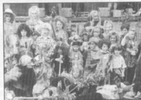
Hejno čarodějnic na Sokolské zahradě 30. dubna 2000; těsně před odletem.

"...Bylo již pozdě, když se vracela babička s dětmi domů.