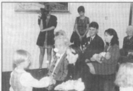
Děti z mateřské školy předaly každé mamince kytičku.