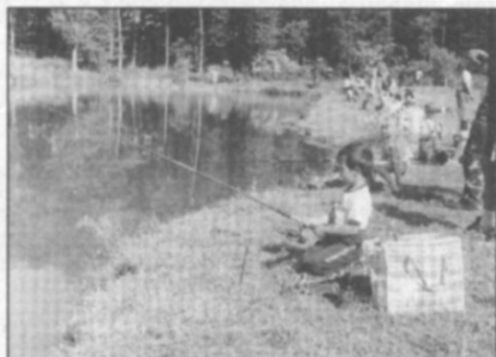
Chytit rybu není jen tak. Chce to soustředění, ale také trochu toho rybářského štěstí.

Vlastní soutěž, s přestávkou na změnu míst a opečení špekáčků, byla rozdělena do dvou věkových kategorií - do 10 a do 15 let - a o tom, že si všichni účastníci vedli více než zdatně, svědčí výsledková listina: