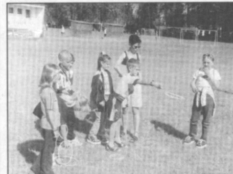
Jednou z disciplín sportovního zábavního dětského odpoledne bylo i házení kroužků.

Poděkování organizátorů patří všem, kteří se pro radost a rozzářené oči dětí podíleli na této zdařilé a hojně navštívené akci. mp