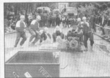
"Start!" Teď už jde častolovickému družstvu o každou desetinu vteřiny.

V mužské části soutěže, která následovala po krátké přestávce určené na představbu trati, největší pozornost, samozřejmě mimo domácího družstva, vzbuzovali obhájci a loňští vítězové poháru, družstvo Trnova A. Vybíhali na trať uprostřed startovního pole a po skončení jejich pokusu bylo jasné, že na ně ani letos nikdo nemá. Čas, 24,90 sec., byl téměř o vteřinu lepší, než do té chvíle vedoucího družstva Malšovy Lhoty. Trnovští svůj čas ve finále ještě o devět desetin vteřiny vylepšili a jejich náskok na druhé družstvo z Dobrého činil 2,37 vteřiny. Třetí ve finále skončily o 0,53 vteřiny Tutleky A.