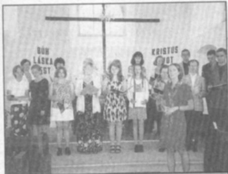
Pěvecké sdružení Melodica při vystoupení v kostelíku na Rabštejně v Kostelci n.O.

o gospely, spirituály a vánoční skladby. Přislíbila již několik samostatných vystoupení v době adventní a bez odezvy nezůstane ani pozvání na společné vystoupení s pardubickými sbory.