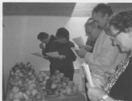
V únoru zahradkáři uspořádali degustaci 32 zimních odrůd jablek.