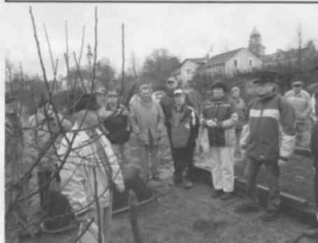
Pro veřejnost se konala praktická ukázka zimního ořezu stromků, kterou navštívila řada zájemců z Častolovic.

Základní organizace Českého zahradkářského svazu Častolovice ve spolupráci s Městysem Častolovice pořádá