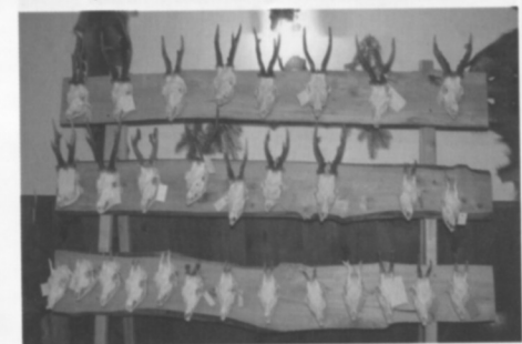
Trofeje srnců z naší honitby za uplynulý rok 2012