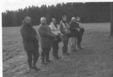
Vítanými pomocníky nejen na honech bývají naši honci