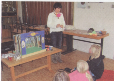
Únor ve znamení pohádek. Hrálo se, zpívalo a program zpestřily i loutky.