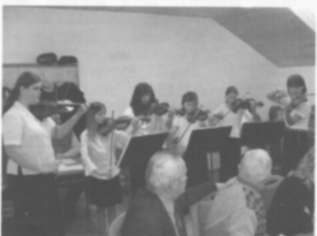
Smyčkový soubor STRUNKA při vystoupení pro Český zahrádkářský svaz