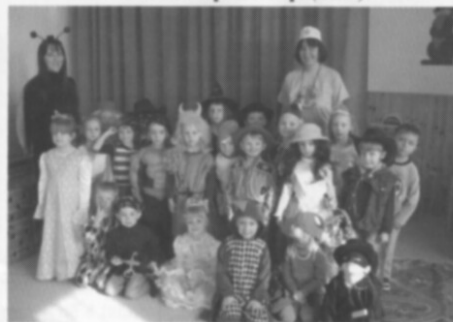
Ve školce se slavil karneval. (str. 9)

Máte pěknou fotografii ze života v Častolovicích? Zašlete ji na adresu zdrojcastolovice@seznam.cz