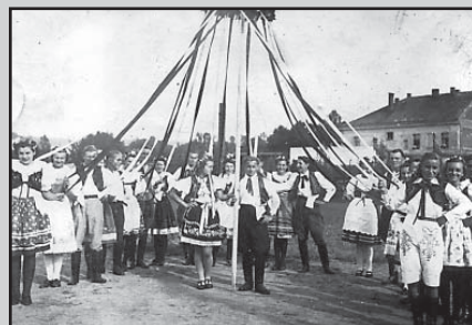
□ Příchod s nazdobenou májkou na Sokolskou zahradu v Častolovicích (30. léta 20. století).