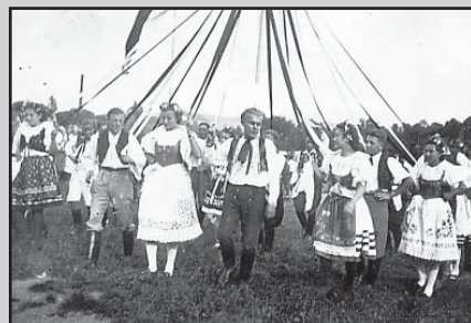
□ Chlapci a děvčata při tradičním stavění máje (nedatováno).

Vážení spoluobčané, pokud i vy vlastníte nějaké historické fotografie, dokumenty, případně jiné materiály ze života obce a jste ochotni se o ně podělit nebo máte k uveřejněním fotografiím nějaké poznatky, kontaktujte mne prosím osobně nebo na mobilním telefonu číslo 724178772.