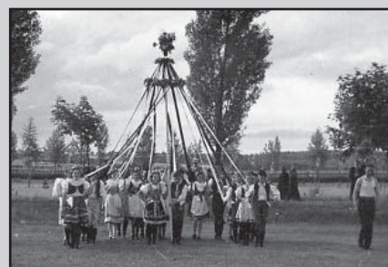
□ Chasa při stavění májky (nedatováno).