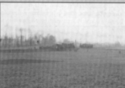
□ V březnu 1945 vykolejili partyzáni vlak mezi Častolovicemi a Česticemi. Událost pro nás zaznamenal fotograf Buřil.