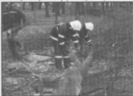
□ Likvidace následků Emmy na Sokolské zahradě.

Dal bych si ten oběd a kafe by taky bodlo. Ruce a záda mě bolí, jako kdybych něco dělal. Musím začít posilovat. Místo toho začíná další pracovní