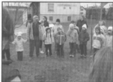
□ Sázení Pohádkovníku