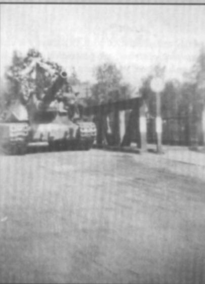
□ Tank Rudé armády vyzdobený květinovým věncem vjíždí po mostě u zámku do Častolovic.