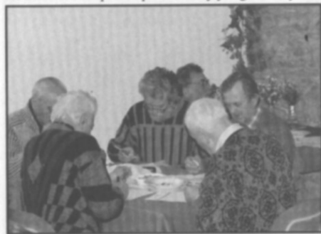
□ Únorová degustace jablek v domě zahrádkářů.

Aby výbor neorganizoval pěkné akce jen pro ženy, tak uspořádal již tradiční degustaci jablek. Tato ochutnávka se konala v sobotu 9. února v zahrádkářské klubovně, kde se sjeli labužníci z celého okresu. Bylo degustováno 36 odrůd zimních jablek, které byly uloženy v normálním, ale kvalitním sklepě. Pro porovnání byly degustovány také