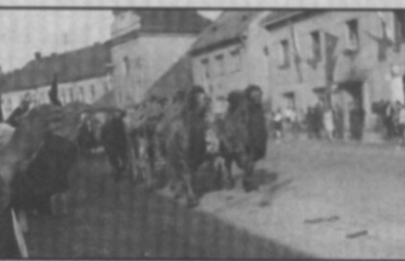
□ K přepravě vojenského materiálu byla používána také zvířata. Na našem snímku projíždí častolovickým náměstím velbloudi.

Váženi spoluobčané, pokud i vy vlastníte nějaké historické fotografie, dokumenty, případně jiné materiály ze života obce a jste ochotni se o ně podělit nebo máte k uveřejněným fotografiím nějaké poznatky, kontaktujte mne prosím osobně nebo na mobilním telefonu číslo 724178772.