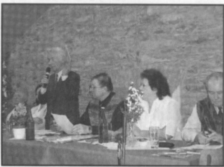
□ Z výroční členské schůze.

Rok 2008 bude podle plánu činnosti na jednotlivé akce velmi rozmanitý a bohatý. Na výroční členské schůzi častolovických zahrádkářů, která se konala v měsíci lednu a byla navštívena velkým počtem členů, byl přijat program, ve kterém je zakotveno celkem 21 velmi zajímavých akcí. Na většinu z nich bude zvána i široká veřejnost.