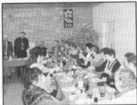
□ Z oslavy MDŽ v zahrádkářském domě.

návali a hodnotili 37 odrůd jablek. Degustace byla anonymní, jablka se hodnotila podle stanovených čísel a kritérií - vzhled, tvrdost slupky, kvalita dužiny, šťavnatost a celková chuť. Téměř 90 minut se hodnotila jak jablka starší, dříve pěstovaná, tak i nová - perspektivní. Na závěr, při kávě a v dobré náladě, proběhla výměna zkušeností na téma: Jak docílit lepší úrodu ovoce na zahrádkách. Všichni přítomní, z Častolovic, Kostelce n.O., Rychnova n.Kn., Hradce Králové, Nového Města a dalších obcí, z ní odcházeli obohaceni znalostmi o pěstování ovocných stromků. Výsledky degustace byly zveřejněny jak v denním tisku, tak na webových stránkách naší ZO. Navíc všichni účastníci degustace obdrželi hodnocení a výsledky písemně.