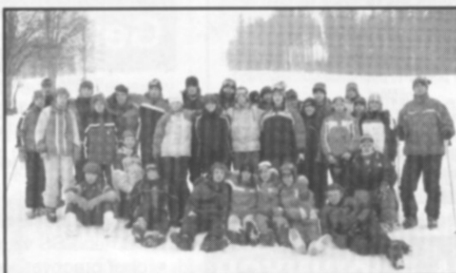
Ve dnech 27.1.-3.2.2007 proběhl v Bartošovicích lyžařský výcvik žáků 7. a 8. tříd naší školy.