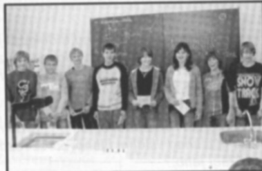
☐ Nejšikovnější poutníci webu.

Ve čtvrtek 8. března odpoledne proběhla na naší škole netradiční soutěž - "Nejšikovnější poutník webu", která měla ukázat, že internet je dnes již úplně běžnou součástí našeho života. Jednalo se o první pokus, jak si změřit své dovednosti ve vyhledávání informací s využitím internetu. Soutěžního klání se zúčastnilo čtrnáct dvojic žáků druhého stupně, které v omezeném časovém limitu hledaly odpovědi na zadané otázky z nejrůznějších oblastí.