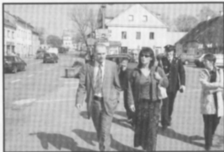
Delegace gminy si v doprovodu starostky prohlédla Častolovice.

V návaznosti na loňské kontakty AFK Častolovice s polským Przewornem, přijela 27. března na oficiální návštěvu našeho městyse delegace gminy