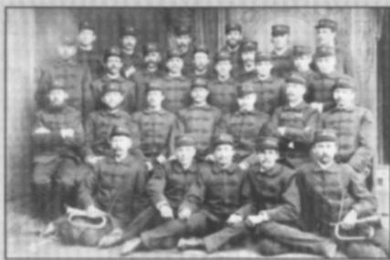
□ Sbor v roce 1895.