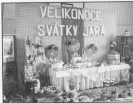
□ Čelo hlavního sálu sokolovny s logem jarní výstavy.

Závěrem výbor ZO ČZS děkuje všem, kteří se více či méně přičinili o úspěšnost této výstavy. Současně se výbor omlouvá těm lidem, kterým zaparkovaná auta, nebo jiné skutečnosti po dobu výstavy, přinesly nějaké těžkosti či problémy, a děkuje za pochopení. JH