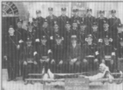
□ Župa Albrechtice číslo 81 - odbor Častolovice 30.6.1929.