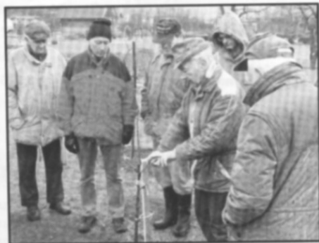
□ Praktická ukáзка zimního řezu na kolonii Bělá 1

Praktická ukáзка zimního řezu ovocných stromků, která se konala v sobotu 17. března na zahrádkářské kolonii Bělá 1, byla další akcí určenou nejen pro členy naší ZO, ale také pro veřejnost. Celková účast i přes déšť a chladné počasí byla překvapivě dobrá. Na ukázkou přijeli i zahrádkáři z Rychnova n.Kn., Týniště n.O. a Kostelce n.O. Přítomným byl po úvodním slově ukázan výchovný řez ovocného stromku prvním rokem po výsadbě, dále udržovací řez na stromech v plné plodnosti a řez na stromech s velkými přírůstky dřevní hmoty. Pro nepřízeň počasí byla ukáзка zmlazovacího řezu nahrazena besedou o nových odrůdách a jejich výhodách.