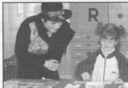
□ V pohádce O Popelce děti třídily rozsypané kornáče podle velikosti i barev.

Pohádkový zápis skončil ke spokojenosti většiny účastníků a je příjemným zjištěním, že ve školství existuje vůle a chuť zkoušet nové a zajímavé nápady, které navíc upevní a zpříjemní tolik potřebné vztahy mezi školou a dítětem, potažmo mezi školou a rodiči.