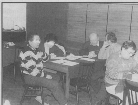
☐ Při únorové degustaci jablek.

I když se "paní Zima" stále nechce vzdát své nadvlády, nezadržitelně se blíží příchod jara a tolik očekávaného sluníčka. Jaro je jedno z nejkrásnějších období v celém roce. Příroda se nejen probouzí ze zimního spánku, ale usměvavé sluníčko přiměje rozkvést první kytičky a štěbetaví ptáčky nám dávají na vědomí radost a chuť do života. I v duši zahrádkáře se v období jara mísí mnoho pocitů, nadějí a očekávání. Optimisté už mají vše připraveno a těší se na první kroky do přírody. Také častolovičtí zahrádkáři v zimě nespali a pro jarní měsíce připravili nejen pro své členy, ale i pro širokou veřejnost, šest pěkných a užitečných akcí.