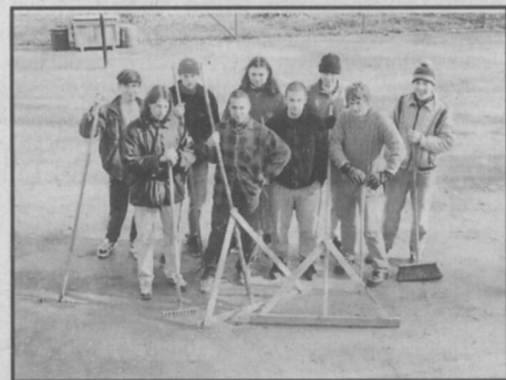
□ Nejpočetnější a nejpracovitější brigáda v roce 1995.

Nejen pro členy našeho oddílu, ale také pro všech-