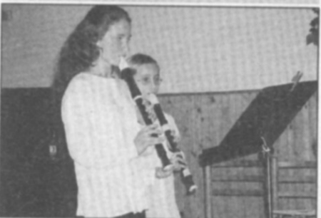
Krásné druhé místo si ve hře na flétnu odnesly z okresní soutěže ZUŠ sestry Fiedlerovy.