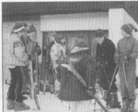
Před odchodem, nebo po návratu z výcviku?