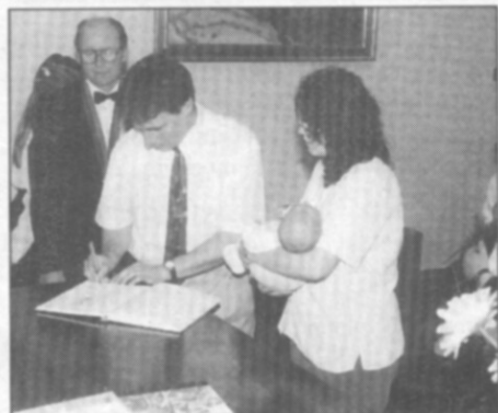
"A rodiče se nám podepíší..."

Po projevu, kterým je pan starosta přivítal mezi obyvatele obce, zahrály, zazpívaly a zarecitovaly svým malým kamarádům děti z mateřské a základní školy.