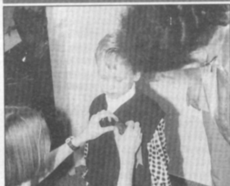
Ještě stužku, ať všichni vidí, že už jsem prvňák!