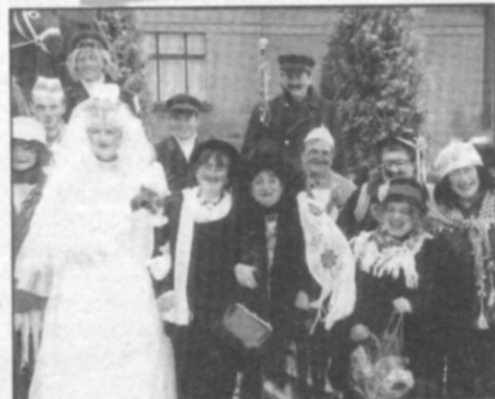
Na 40 prokřehých masek se shromáždilo u hasičské zbrojnice, aby oslavilo průvodem obci příchod masopustu 2000.

SDH v Častolovicích připravuje: 30. duben 2000 - "Pálení čarodějnic" na Sokolské zahradě. 17. červen 2000 - IV. ročník soutěže v požárním útoku "O putovní pohár starosty obce". Bližší informace budou zveřejněny na plakátovacích plochách. mf