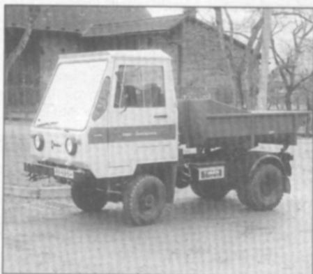
Do autoparku obce přibýlo nové vozidlo.