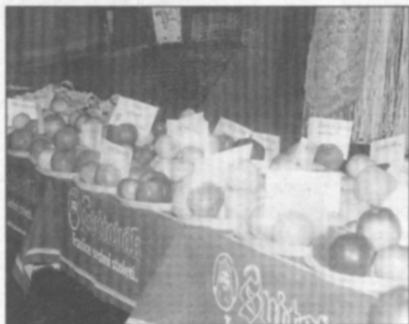
47 odrůd zimních jablek bylo přichystáno na častolovické degustaci.

Podle prezenční listiny tu bylo kolem šedesáti lidí, a to nejen z naší místní organizace. Jsem rád, že pozvání přijali zástupci zahrádkářů z Rychnova, Kostelce, Byzhradce, Holic, Čestic, Žďáru a cestu mezi nás si našli i nečlenové ČZS z Častolovic. Škoda jen, že velký mráz odradil další potenciální degustátory, ale i tak byla účast velmi pěkná.