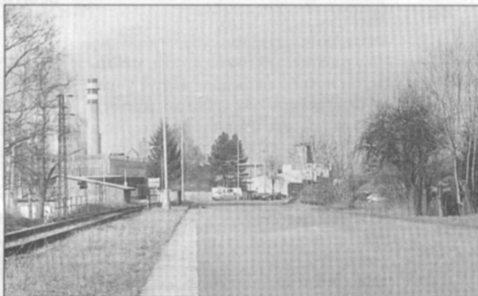
● Očištěná stará silnice k ORSILu.

Nezdá se vám, že malování zastávky ČD je taková Sísyfovská