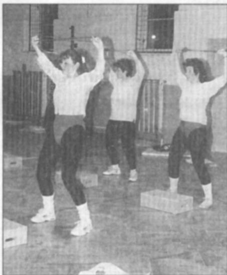
• Bodystyling nejen posiluje, ale i krásí tělo.

v pondělí a ve čtvrtek step aerobic a bodystyling, ve středu aerobic mix - vždy od 19,00 hodin v sokolovně.