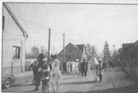
• Masopustní průvod prošel letos Častolovicemi 21. února.