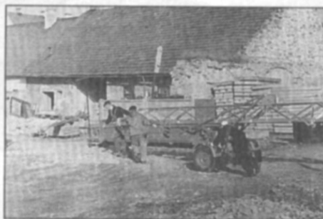
● Úklid v proluce po bývalém č.p. 12 na Náměstí.

Zhruba je to šest lidí. Na takový plán práce, který tu mám před sebou ... Program místního hospodářství byl na tento stav stavěný nebo jsou to práce, které je prostě nutné udělat, ber kde ber?