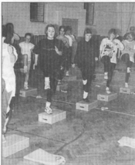
• Step aerobic je pěkná "makačka".

Celodenní program byl rozdělen do tří samostatných celků. Dopoledne aerobic mix a step aerobic, odpoledne potom bodystyling, neboli, jak název napovídá, tvarování těla. K němu využíváme statických silových cvičení s gumičkami, které cíleně působí na vybrané svalové partie a tím nejen posilují, ale především tvarují celé tělo.