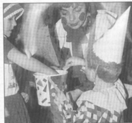
● Menším dětem rozdával sladkosti sympatický "šáša".