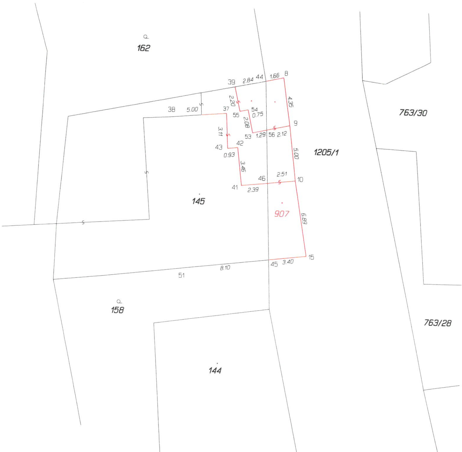
Seznam souřadnic (S-JTSK)

Číslo bodu Souřadnice pro zápis do KN Souřadnice určene měřením