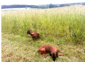
Vyhánění srnčat při senoseči