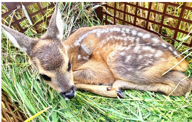
Zachráněné srnče. Připravené na vypuštění po posekání louky.

Obrovské lišty žacích strojů připraví každé jaro o život desetitisíce srnčat po celé republice. To se rozhodl změnit náš kamarád a skvělý člověk pan Aleš Chládek. Se svým dronem létá po celých východních Čechách a navštívil několikrát i naši honitbu. Během prohledávání travních porostů se podařilo ve spolupráci s členy zachránit několik desítek srnčat, která měla to štěstí a nechala se objevit termovizí a zároveň odchytit do připravených košů. Když pak člověk vidí opětovné setkání srny a srnčete, tak si může říct, že ta všechna brzká vstávání a nekonečné hovory s majiteli sekaných ploch dávají smysl... Závěrem bych chtěl všem čtenářům popřát krásné léto a mnoho zážitků v přírodě.