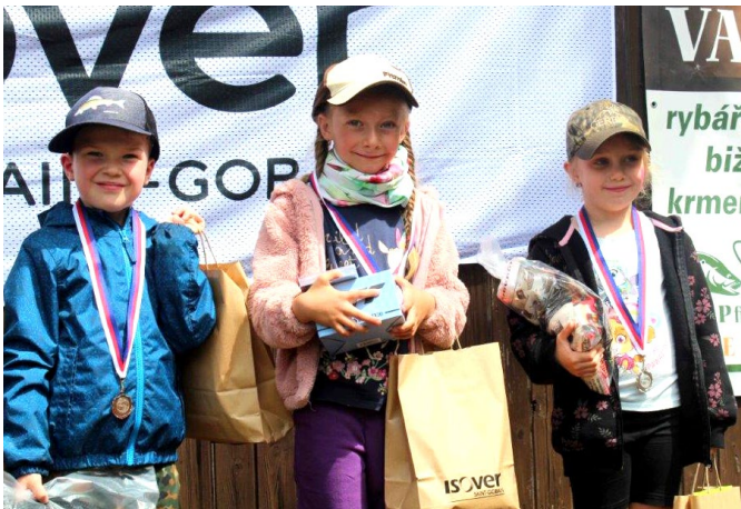
Vítězové mladší kategorie dětských závodů