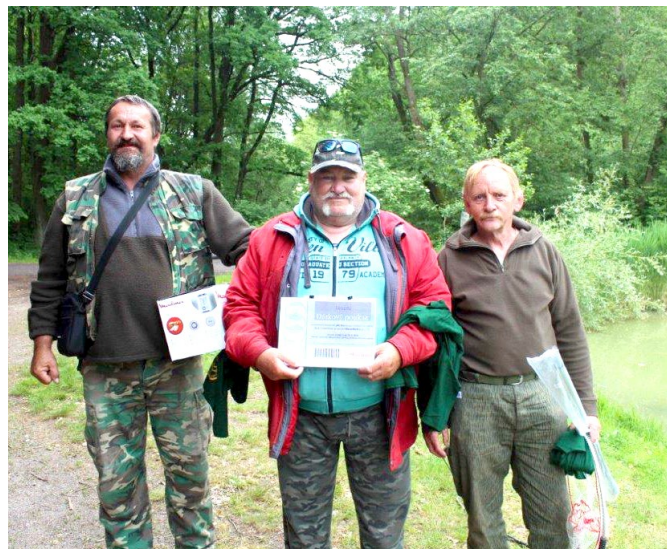
Závody dospělých – vítězové

S pozdravem „Petrův zdar“ se těšíme na další ročník.