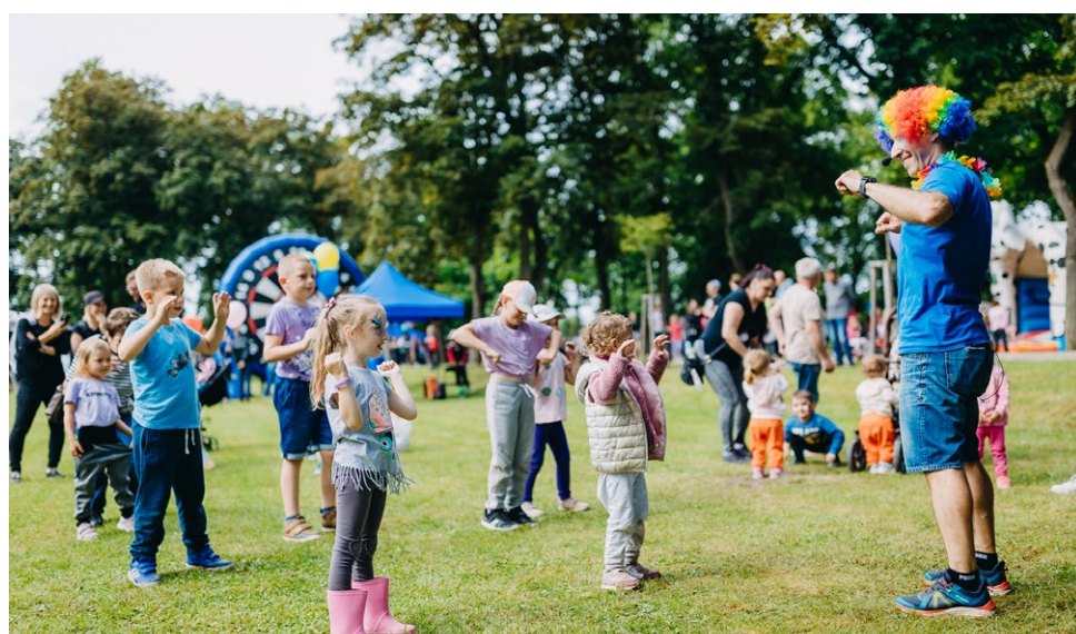
Několik momentů z akcí Pálení čarodějnic, Dětského dne a Svatovítské pouti.