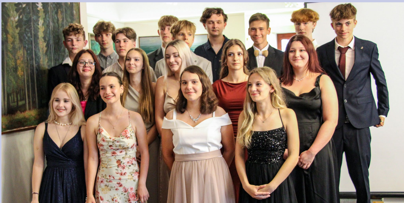
Slavnostní vyřazení devátých tříd v Hudečkově galerii.