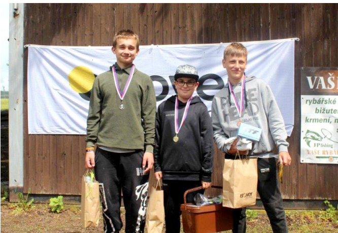
Vítězové starší kategorie dětských závodů

Výbor MO ČRS Častolovice děkuje všem sponzorům, pořadatelům. S pozdravem „Petrův zdar“ se těšíme na další ročník.